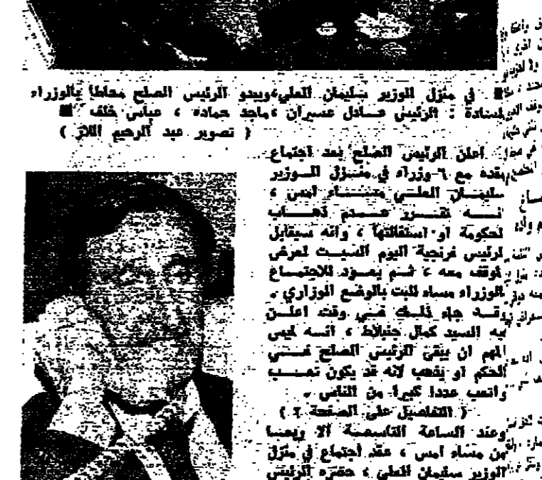
الرئيس فرنجيبة استقبل وزير الاعلام المصري الدكتور كمال ابو الجند ، ويبدو من البيان ، والنائب الدكتور مبدالله الراسي ، وزير الاعلام محمود عيسر ، السفير السعودي الشيخ محمد منصور الربيع، مدير عام وزارة الاعلام السيد رامز خزن